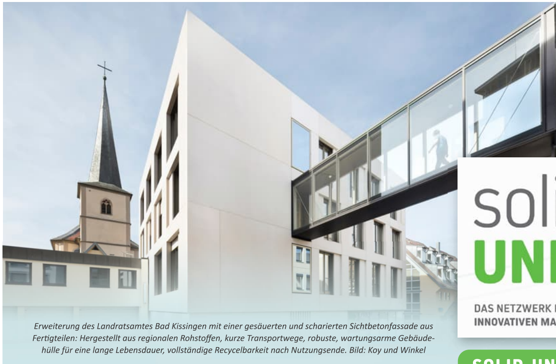
Erweiterung des Landratsamtes Bad Kissingen mit einer gesäuerten und scharierten Sichtbetonfassade aus Fertigteilen: Hergestellt aus regionalen Rohstoffen, kurze Transportwege, robuste, wartungsarme Gebäudehülle für eine lange Lebensdauer, vollständige Recyclbarkeit nach Nutzungsende. Bild: Koy und Winkel