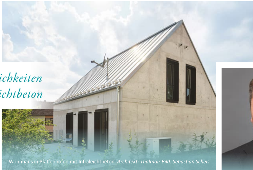
Wohnhaus in Pfaffenhofen mit Infraleichtbeton. Architekt: Thalmair